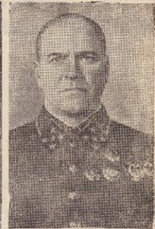
Маршал Советского Союза Г. К. Жуков