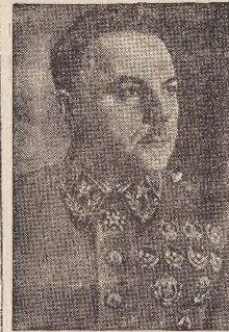
Маршал Советского Союза К. Е. Ворошилов

Взяты следующие трофеи: орудий—222, минометов—178, пулеметов—512, винтовок—5.020, шестиствольных минометов—4,